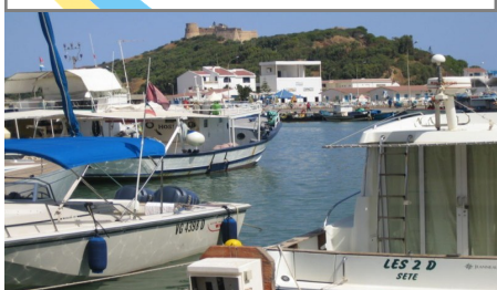
Port Tabarka - Jendouba - Tunisie

(...) Ministre Terzi - continue de la 1ère