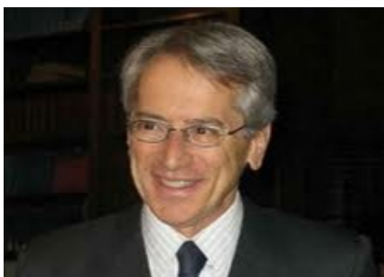
Giulio Terzi di Sant'Agata Ministre des Affaires étrangères de la République italienne

Dans quelle mesure le Programme de coopération transfrontalière Italie Tunisie s'avère complémentaire aux priorités identifiées au niveau national dans la coopération bilatérale avec la Tunisie?