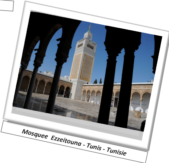
Mosque Ezzeitouna - Tunis - Tunisie

Les Voyages de la Connaissance , chef de file ProPiTer .