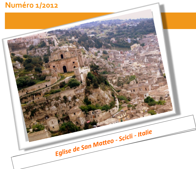
Eglise de San Matteo - Scicli - Italie