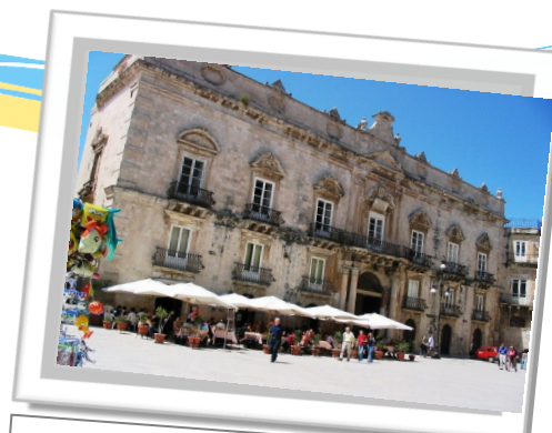
Siracusa - Palazzo Beneventano - Italie

L'Agence de Promotion de l'Industrie , seul chef de file tunisien dans le cadre de cet appel, avec le projet Compass vise à la création d'un réseau transfrontalier pour accompagner, soutenir et mieux gérer les processus de coopération économique entre la Sicile et la Tunisie.